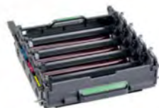
แม่แบบสร้างภาพ (ดรัม) DR-451CL ประมาณ 30,000 หน้า