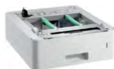
ถาดกระดาษเสริมสูงสุด 500 แผ่น LT-340CL**