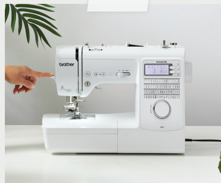
มีที่สนเข็มอัตโนมัติ สะดวกและไม่เสียเวลา สนเข็มจักร