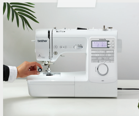
พร้อมที่จะเย็บได้อย่างง่ายดาย เพียงใส่กระสวย ด้านล่าง และร้อยด้ายตามทิศทางของลูกศร