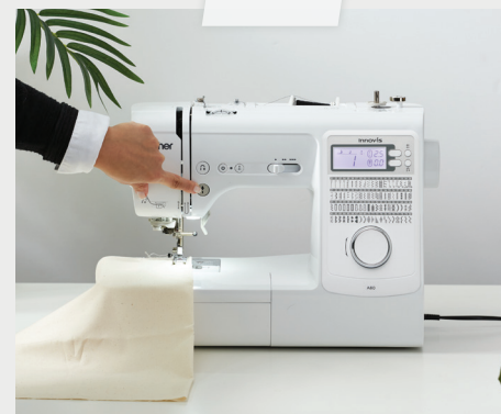
เริ่มและหยุดเข็มได้ง่ายดายเพียงกดปุ่ม โดยไม่ต้องใช้เท้าเหยียบ