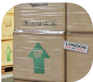
ฉลากระบุการใช้งาน