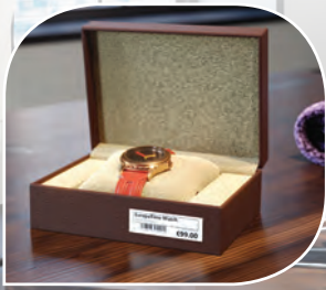
ฉลากราคา/บาร์โค้ด