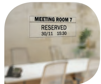
ฉลากป้ายภายในสำนักงาน