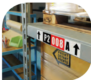
ฉลากป้ายชั่วคราว