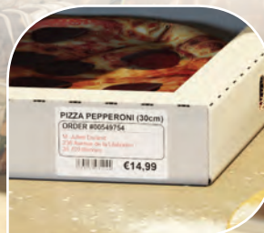
ส่งชื้อกลับบ้าน

ร้านค้าประเภทส่งชื้อกลับบ้านสามารถพิมพ์รายละเอียดของคำสั่งซื้อ รวมถึงข้อมูลที่อยู่สำหรับจัดส่งด้วย