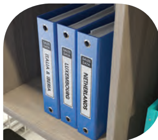
ฉลากติดแฟ้มจัดเก็บเอกสาร