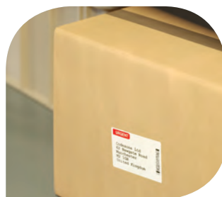
ฉลากเพื่อการขนส่ง