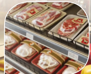
การติดฉลากที่ขอบของชั้นวาง