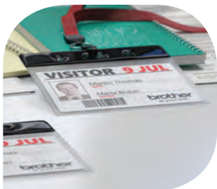
ฉลากติดบัตรผู้มาเยือน