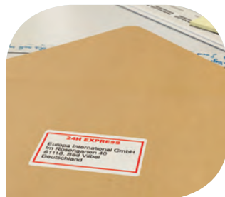
ฉลากไปรษณีย์