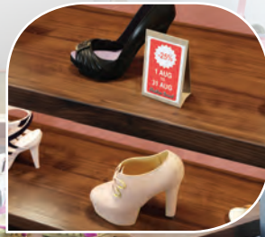
ป้ายโปรโมชั่น