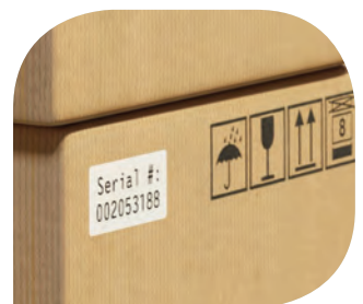
ฉลากบรรจุภัณฑ์ผลิตภัณฑ์ต่างๆ