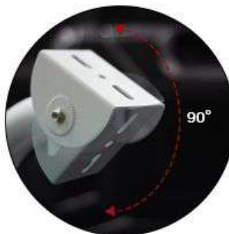
ก้มเงยได้ 90°