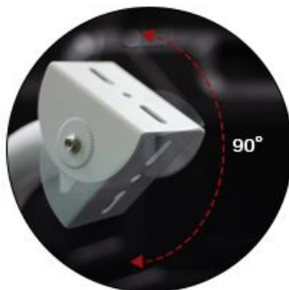
ก้มเงยได้ 90°